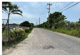
↑前面道路は「観音堂線」