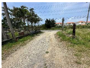
↑道路からの進入部分